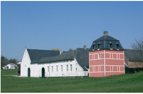
Hof 'Oude Voorde'